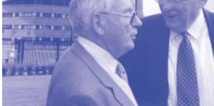
À gauche : visite de la tour de contrôle pouvant orienter les plus gros porteurs, par tous les temps, 24 heures sur 24 et 7 jours sur 7.