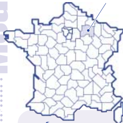
L'aéroport de Vatry dans la Marne